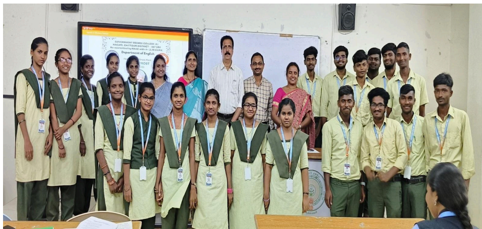
Principal, judges and faculty of English with the participants of the competition 29.01.2025