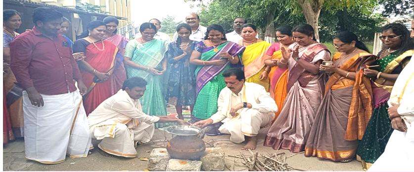
PONGAL CELEBRATION 10-01-2025

Active participation of the staff and students