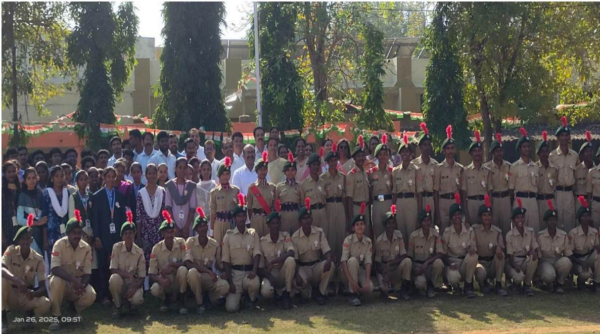
Group Photograph with the NCC Cadets, prize winners, staff and students