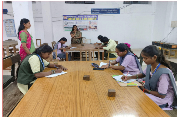
Students participating in Essay Writing Competition