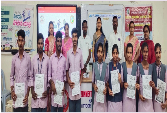
Students with the Handouts of the career planning strategies provided by the Way Foundation