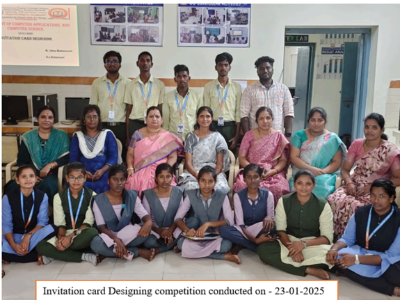
Invitation card Designing competition conducted on - 23-01-2025