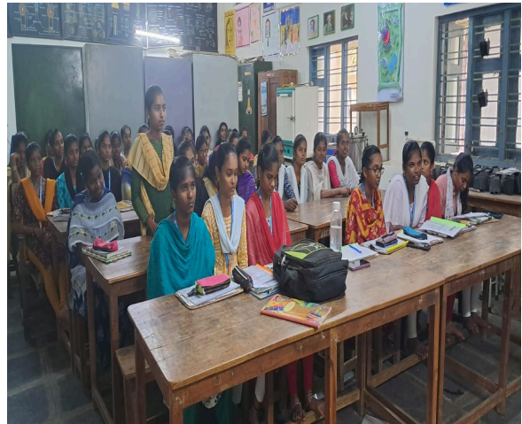
Girl participants of the programme