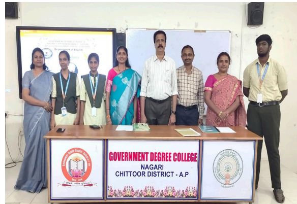
Principal and staff with the winners of Poetry Recitation Competition