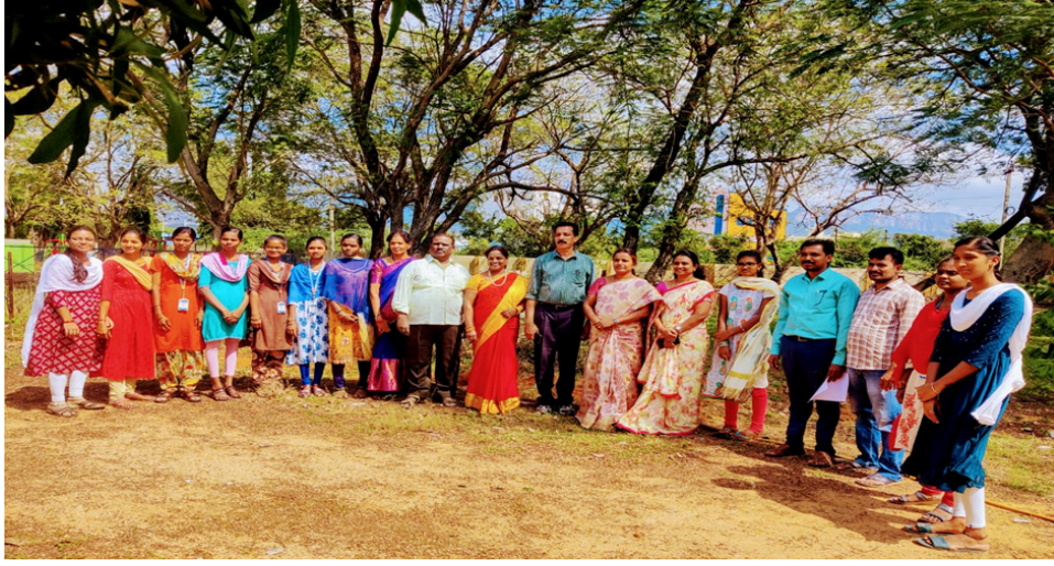
Principal, Vice Principal, staff and students with saplings before the commencement of plantation and during the plantation